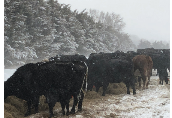
Los cortavientos como la una que se muestra arriba pueden mejorar la supervivencia del ganado la eficiencia de la alimentación. Una cerca de nieve viva puede ser una ventaja valiosa para productores de ganado que enfrentan el clima duro e impredecible de Nebraska.